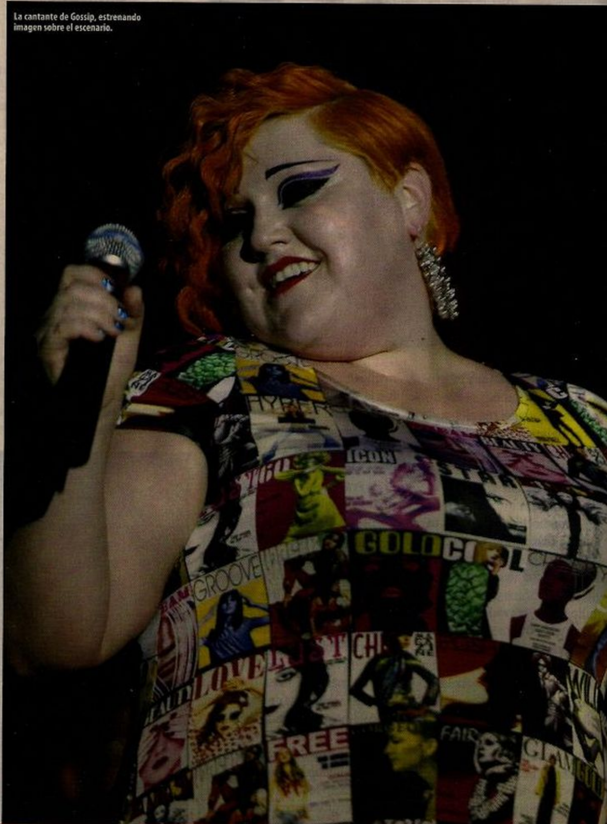
La cantante de Gossip, estrenando imagen sobre el escenario.

"PIENSO CONSTANTEMENTE EN EL SEXO. LA GENTE QUE NO PIENSA MUCHO EN ELLO DEBE SER PORQUE NO HA TENIDO BUEN SEXO DE VERDAD EN TODA SU VIDA", BETH DITTO